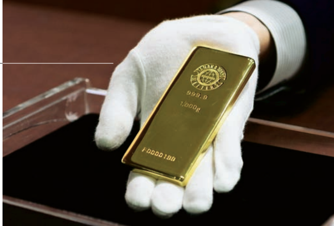
GOLDBARRENKAUF: Die Lagerung des Kleinods sollte bedacht werden

Um die Seriosität der Sparplan anbietenden Edelmetallhändler zu beurteilen, wurden in den Fragenkatalog auch entsprechende Kriterien aufgenommen. Wichtig ist dabei, ob der Edelmetallhändler Mitglied des Berufsverbands des Deutschen Münzenfachhandels e.V. ist, ob schon Jahresabschlüsse im Bundesanzeiger veröffentlicht wurden und wie lange bereits Sparpläne angeboten werden.